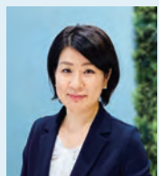
ウェルスマネジメント部 部長 チーフコンサルタント

私たちは以前、証券会社に勤務し、資産運用のご提案を行っていました。大手金融機関では、場合によっては「売り手都合」になることも。お客様が正しく理解できていなかったり、投資に警戒心を抱かせてしまったりすることを心苦しく感じ、課題意識を持っていました。そんなときAFSのビジネスモデルとディメンショナル社を知り、既存の金融機関にはできないサービスに魅力を感じて入社を決めたのです。大切な資産を投じる価値がある本当に良い商品を提案できること、長期にわたって資産全体を増やしていくお手伝いができることにワクワクしています。