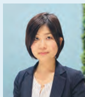
ウェルスマネジメント部 主任 コンサルタント

大手地銀勤務を経て、大手証券会社にて富裕層向け資産運用コンサルティング業務を経験。2021年、青山フィナンシャルサービスに入社。AFP認定者。金融知力普及協会認定インストラクター。