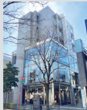
ミル・ロッシュビル

今回の組成により、組成累計額は1,000億円を超え、累計組合数も60組合となりました。これからも魅力的な商品組成を展開してまいります。