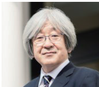
順天堂大学大学院医学研究科神経学 教授 順天堂大学医学部神経学講座 教授 (医学部長・医学研究科長 兼任)