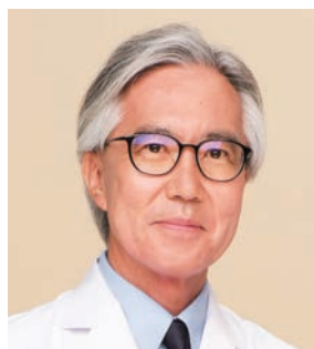
東京大学大学院医学系研究科 総合放射線腫瘍学講座 特任教授